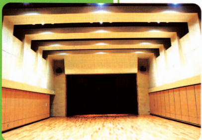
音響設備も整った多目的ホール