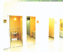
ユニバーサルデザインを取り入れたトイレ