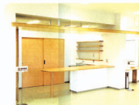
軽食も可能な喫茶室