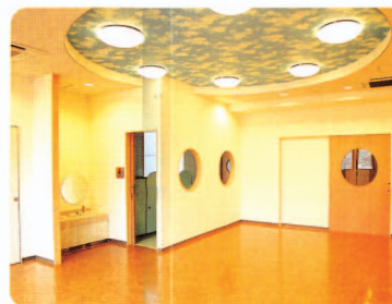
子育て交流サロン