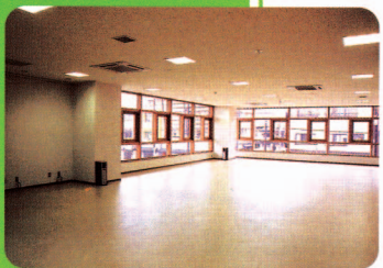
広々としたエントランスホール